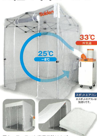
■クーラーテント専用日除けカバー

軽くて組み立てが簡単です。 様々な場所に涼空間を設置(屋内用)でき 循環式なので効率よくすぐに冷えます。